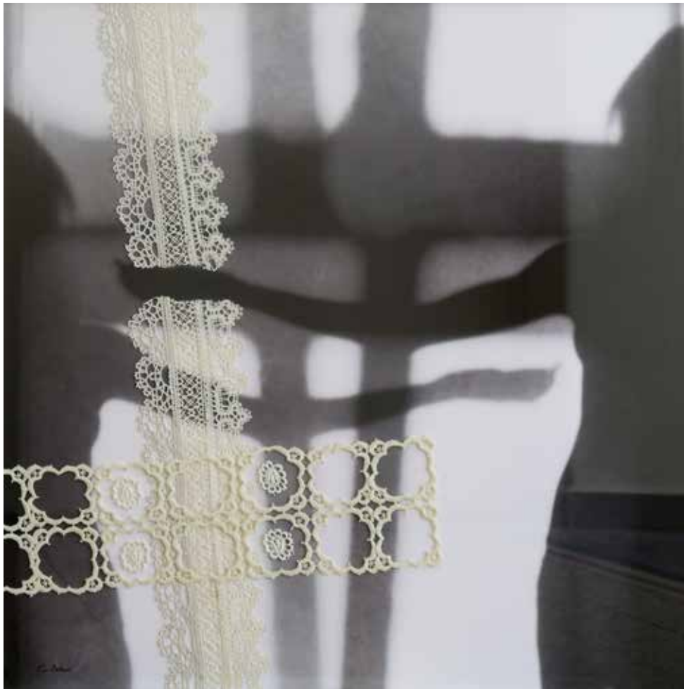
Sem tvoja dediščina 2 analogna fotografija in reciklirana čipka, 80 × 80 cm, 2023

Multimedijska umetnica Eva Petrič se predstavlja v izvirni poetiki, ki predstavlja dialog in hkrati simbiozo med analogno fotografijo in reciklirano čipko. V motivnem smislu pa povezuje avtoportretno podobo s kolažiranimi čipkastimi trakovi. Forma razpela se pojavlja tako v avtoričini telesni drži kot v razporeditvi čipke. Silhueta telesa, njeni odsevi, jasnost in zabrisanost skozi nekakšne sfumature, temina in svetloba so žlahtni čari črno-belega fotografskega posnetka in hkrati atmosfera prostora, za katero se zdi, da govori o prehajanju med fizičnim in duhovnim. To potrjuje tudi čipka, ki sega v prvi plan, vzpostavlja strukturalni moment, prinaša vzorec estetske popolnosti in misel na ženske ročne spretnosti. S svojimi perforacijami pa dodatno naglasi prehod med materialnim in duhovnim, med tukaj in tam.