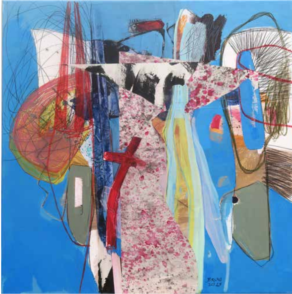
Brez naslova mešana tehnika na platnu, 80 × 80 cm, 2023

Klemen Brun svoji barviti in likovno dinamični slikarski stvaritvi pušča brez naslova. Ustvarjeni sta v mešani tehniki, skozi katero se manifestirajo risba, barva in kolažne aplikacije. Perceptivne in oblikotvorne karakteristike oblik in barv nosijo izraz in informacijo, ki gledalca preko stilizirane figure, simbolov in asociativnih namigov vodijo k zgodbi o križu. Sliki sta Zmaga svetlobe v smislu moči in prekipujočega likovnega življenja. Avtor po površini razporeja risarske konstrukte in barvne ploskve, ki so trdne in jasno artikulirane, pa tudi prepuščene povsem stihijskemu polivanju barve in tašističnim rešitvam. V večplastnosti in zgoščenosti ima vsako likovno izrazilo in vsak segment svoj prostor, da se v polnosti osmisli ter soustvarja uravnoteženo kompozicijo.