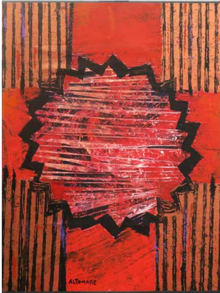
Cosi, come nell'ora nona akril na platnu, 80 × 60 cm, 2023