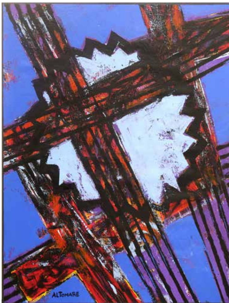
Cosi, come nell'ora nona akril na platnu, 80 × 60 cm, 2023