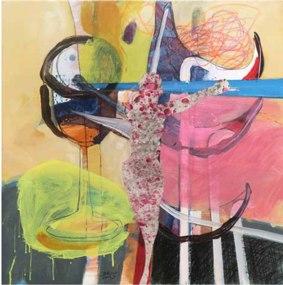
Brez naslova mešana tehnika na platnu, 80 × 80 cm, 2023