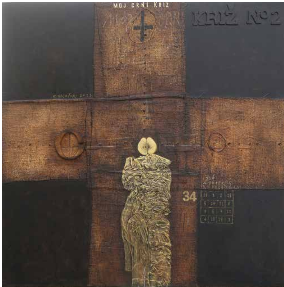
Moj črni križ akril in kolaž na platnu, 80 × 80 cm, 2023

Rudi Skočir s svojo intimno ikonografijo vselej znova razkriva vero v življenje, v svetlobo in s tem v upanje. Čeprav je ženska figura najpogostejša pripovedovalka njegovih zgodb, slikarjev izrazni repertoar postaja vse bogatejši z novimi simbolnimi elementi. Tokrat je avtor slikovno polje zaznamoval z obliko križa. Ustvaril jo je s kolažnimi aplikacijami, zaradi katerih blago izstopa in zaživi v dinamičnem in slikovitem površinskem dogajanju, na katerem brbotajo strukture in pogled zaposlujejo številni detajli. Življenje utripa, likovno in vsebinsko. Pridružujejo se mu linije, numerološka znamenja in besedna sporočila. V Našem belem križu ima osrednji simbolni pomen jabolko, v Mojem črnem križu se pridružuje silhuetno oblikovani draperiji, ki asociira na žensko figuro. Zgodbama ni videti konca.