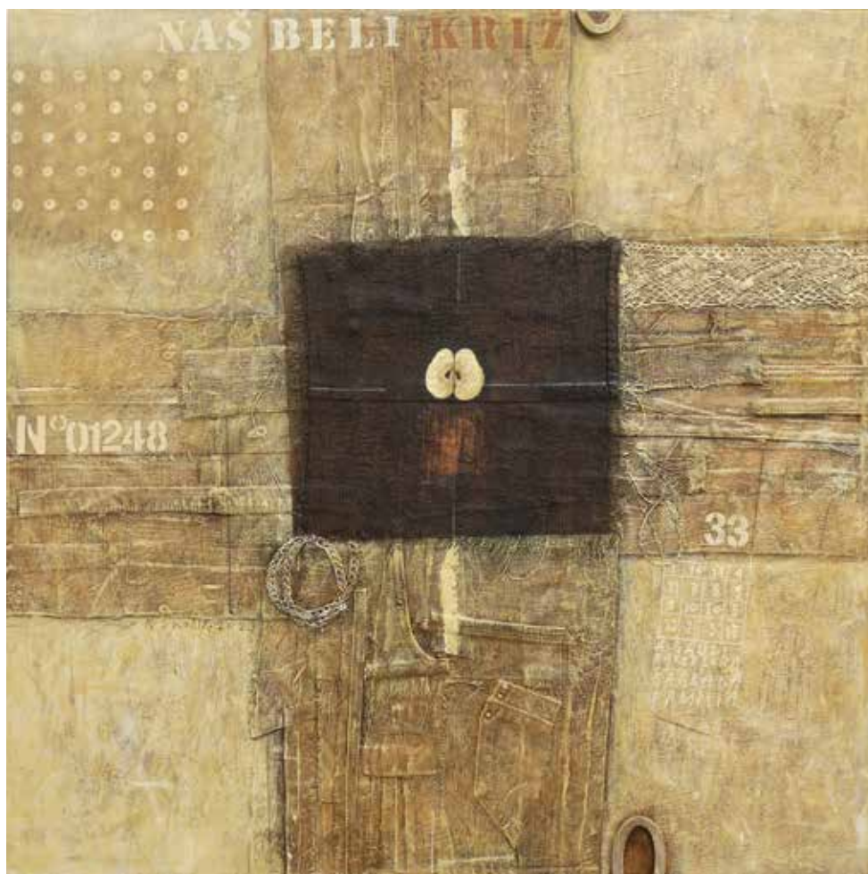
Naš beli križ akril in kolaž na platnu, 80 × 80 cm, 2023