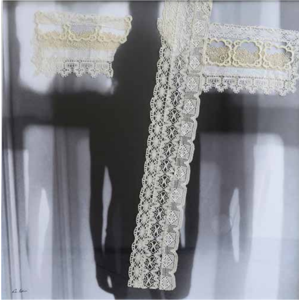
Sem tvoja dediščina 1 analogna fotografija in reciklirana čipka, 80 × 80 cm, 2023