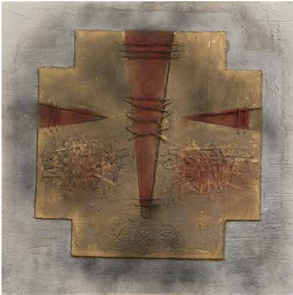
Passione (in arte povera) mešana tehnika na platnu, 80 × 80 cm, 2023