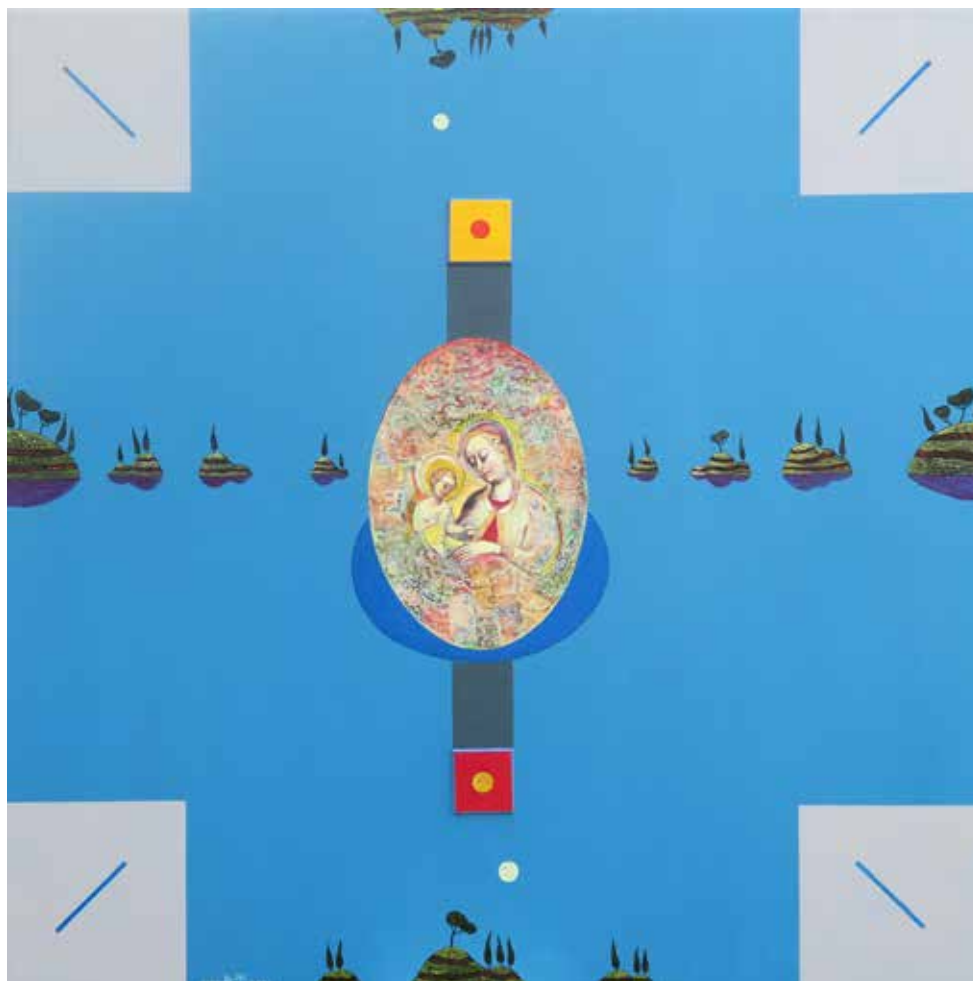
Marija v mediteranski krajini akril in kolaž na platnu, 80 × 80 cm, 2023