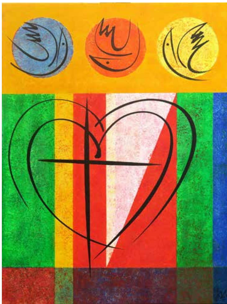
Sacra conversazione, meditacija o križu I. akril na platnu, 80 × 60 cm, 2023