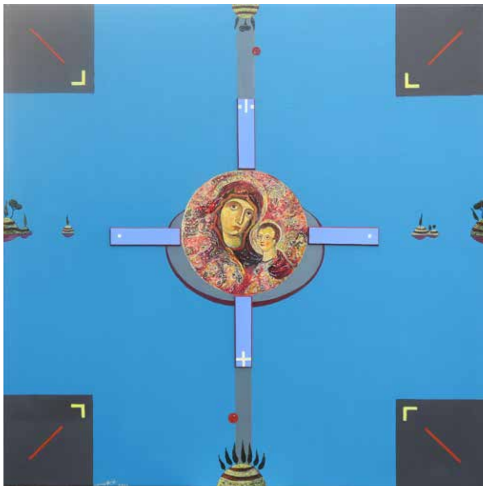
Marija v mediteranski krajini akril in kolaž na platnu, 80 × 80 cm, 2023