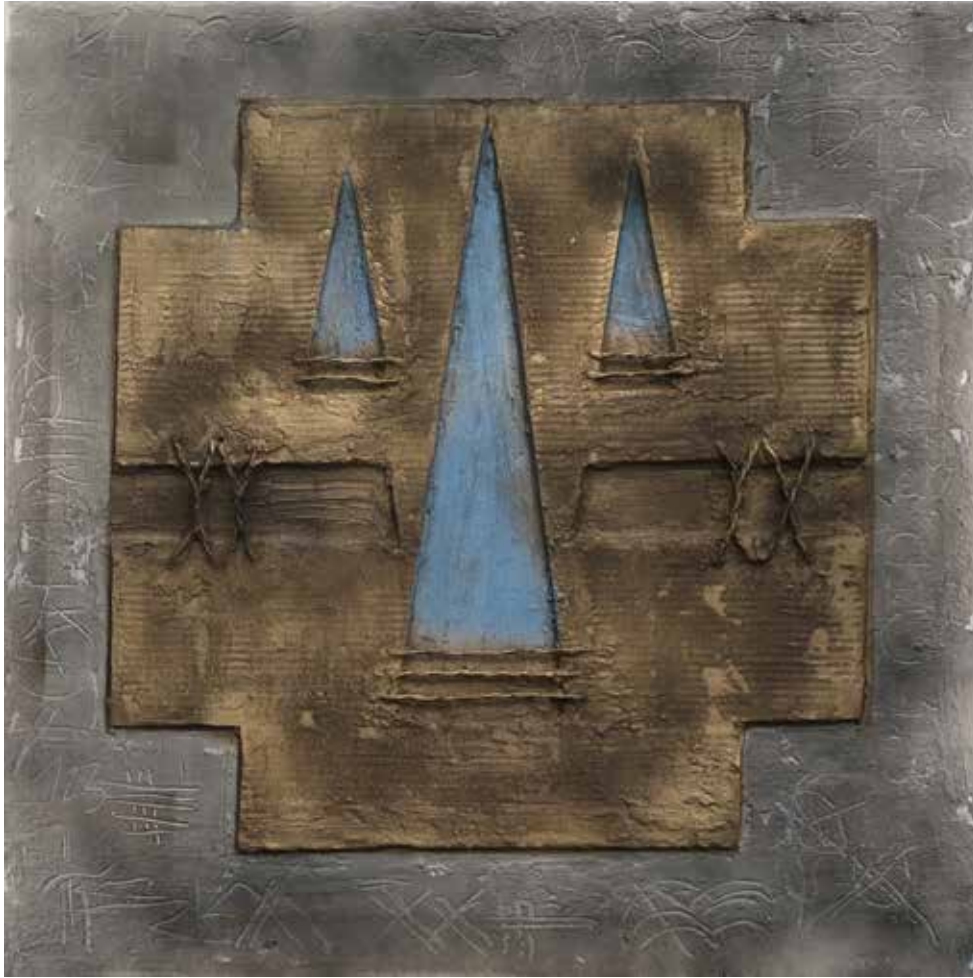
Ascensione (in arte povera) mešana tehnika na platnu, 80 × 80 cm, 2023