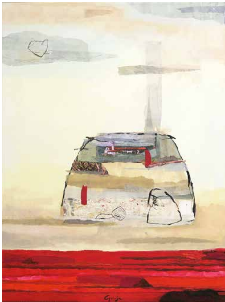
Nova dimenzija križa akril in kolaž na platnu, 80 × 60 cm, 2023