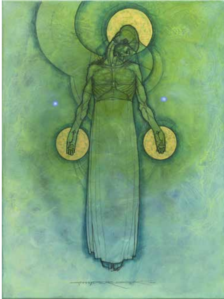
Vstajenje akril na platnu, 80 × 60 cm, 2022