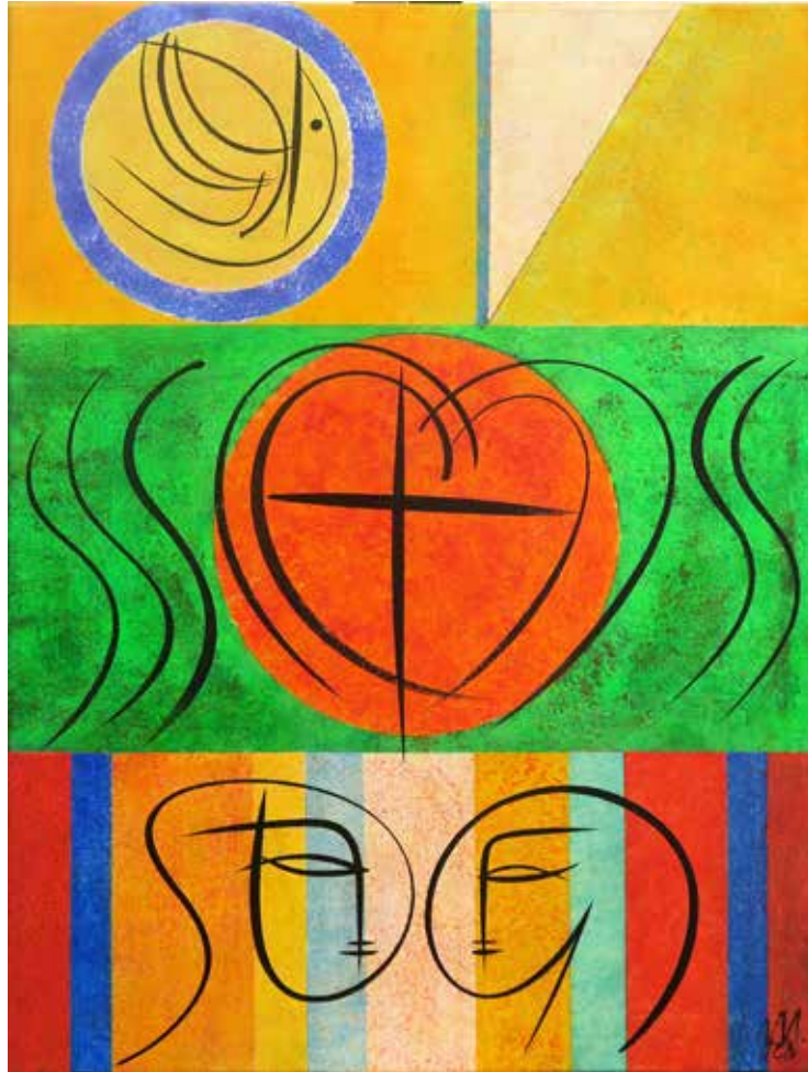
Consummatum est, meditacija o križu II akril na platnu, 80 × 60 cm, 2023

Umetniška dela Mateja Metlikoviča pripadajo različnim tehnološko-likovnim rešitvam. Vselej jih avtor uresničuje znotraj duhovne, sakralne in simbolno pomenljive tematike. Specifični slog njegovega izražanja določajo abstraktne, barvno močne, predvsem monokromne podlage, oblikovane v izčiščene in sevne ploskve. Na njih s kalgirafsko tekočo in virtuožno gibko črtno sledjo ustvarja akterje dogajanja in elemente, skoncentrirane na temeljne poteze. Ti postanejo znaki in simboli, arhetipsko prepoznavni, a vitalizirani z vedno novimi variacijami. Izrečeno bistvo, ki ga prinašajo križ, srce, golob ali nakazana figuralna lika, ki predstavljata motiv Sacra conversazione , je oblikovno izbrušeno, jasno, likovno prepričljivo in zgovorno, ne glede na motivno vsebino.